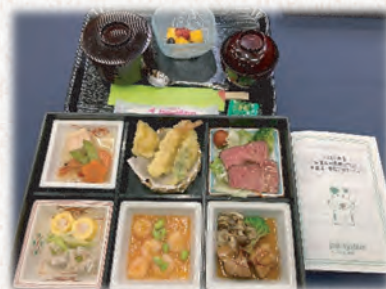
昨年度提供したランチ

*お預かりした個人情報は、参加者集約・詳細の連絡以外に使用いたしません。参加者全員のお名前を記入してください