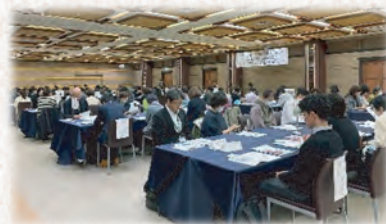
昨年の交流会の様子