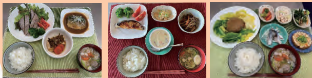
※試食商品の写真はイメージです

シングル世帯や少人数家族、たくさんは食べられないけど、しっかり栄養を取りたい方にピッタリな、パルシステム商品の試食会を行います！レンジだけの調理や、簡単な調理で食べられるものばかり！是非ご参加ください♪