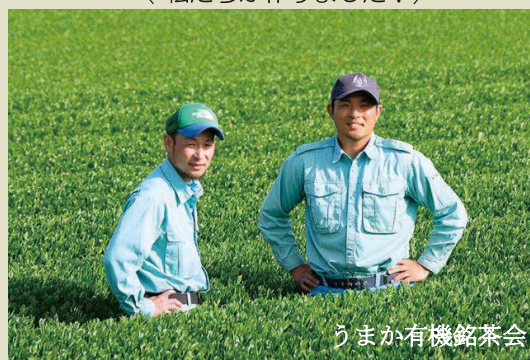
うまか有機銘茶会

一般的に茶の有機栽培はむずかしいと言われています。 「塗木製茶工場」では20年ほど前から有機栽培をスタート。 のちにここで有機栽培を行う農家16戸が、「うまか有機銘 茶会」を設立し産直産地になりました。 野草や香辛料からとったエキスで害虫対策するなどの工夫を 重ね、業界の常識を打ち破って来ました。丁寧な土づくりに 心をくだき、化学合成農薬を使用した場合の何倍も手間暇か けて有機栽培の、「うまか」緑茶を育てています。