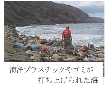
海洋プラスチックやゴミが 打ち上げられた海

【内 容】 株式会社ニチレイ、カゴメ株式会社、富士山の銘水株式会社 による、プラスチック削減の実践報告と、パルシステム「プラスチック排出総量削減」 の取り組みについて