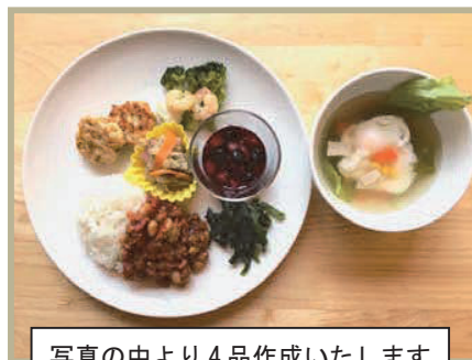
写真の中より4品作成いたします

パルシステムの冷凍の野菜は、美味しくって便利なのをご存知ですか？ 一度使ったら便利なので、つい冷凍庫に常備してしまうこと間違いなし！ 面倒だと感じる朝のお弁当作りのアイデアも教えてもらえるかもしれません♪